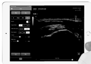
タブレットは別売りです。

一般名称: 汎用超音波画像診断装置 医療機器認証番号 230AGBZX00093000