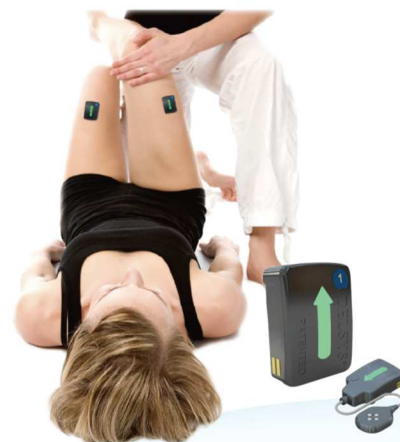
DELSYS ® WEARABLE SENSORS FOR MOVEMENT SCIENCES