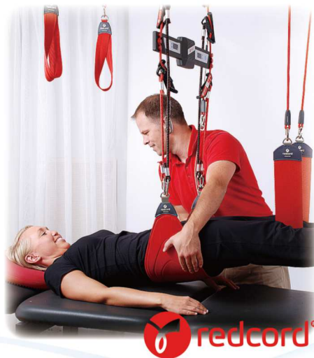
ノルウェー生まれの スリングエクササイズ 「レッドコード」