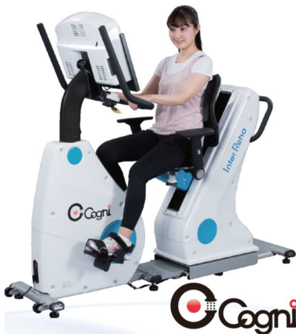
国立長寿医療研究センター監修 認知トレーニングエルゴメーター 「コグニバイク」